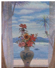
小原稔《サンパンがゆく》1989年 〔眺めのいい部屋〕より〕

〔展示室1〕 [佐渡島の金山]世界文化遺産登録1周年記念 佐渡の作家たち 〔展示室2〕 眺めのいい部屋 〔展示室3〕 近代美術館の名品