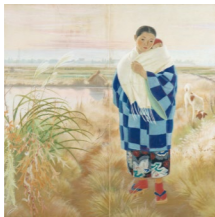
金子孝信《子守り》1938年頃 〔[新収蔵]金子孝信とその時代〕より〕

〔展示室1〕 [新収蔵] 金子孝信とその時代 〔展示室2〕 小さなものたち 〔展示室3〕 近代美術館の名品