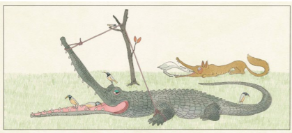
「オオカミとサギ」【きつねがひろったイソップものがたり1】より 1987年 ©空想工房 画像提供：津和野町立安野光雅美術館

画家・安野光雅(1926-2020)が描いた独自の世界観をもつ絵本作品は、国際アンデルセン賞画家賞を受賞するなど国内外で高く評価されました。本展では、画家として独立する前の教員時代に着目し、多彩なジャンルの作品を学校の授業科目に見立てて紹介します。