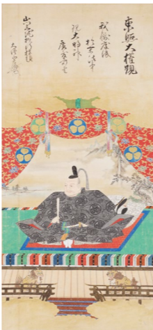
東照大権現像 江戸時代初期(17-18世紀) 久能山東照宮博物館蔵

静岡に位置する国宝・久能山東照宮は徳川家康を神として祀る神社です。本展では、ここに伝来している家康所用の甲冑をはじめ日常生活で使用した品々、歴代将軍が奉納した武器や書画を紹介します。特に、歴代15代将軍全ての甲冑の展示は見どころです。