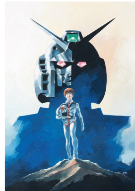
『機動戦士ガンダム』(劇場版) ポスター原画 ©創通・サンライズ

『機動戦士ガンダム』のキャラクターデザイナー兼アニメーションディレクターをつとめ、現在は漫画家としても活躍する安彦良和(1947-)の回顧展。デビュー当初から最新作の漫画作品まで、1,000点を超える貴重な作品、資料によって約50年の軌跡を紹介します。