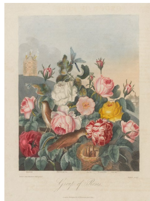
ロバート＝ジョン・ソートン 「フロラの神殿」より 1812年

庭—この言葉から、人は何を思い浮かべるでしょうか。丹精込めて造形された庭園、ご自慢の花壇や家庭菜園、あるいは自分だけの秘密の空間。様々な美術作品を通して、無限の想像力をかきたてる庭というものを味わってみましょう。