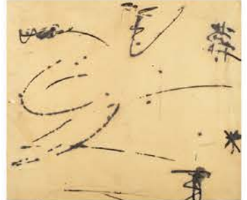
中村木子《作品C》1950年代中頃