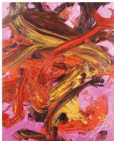
白髪一雄《天女の舞》2000年 尼崎市蔵