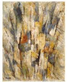
難波田龍起《森の詩》1960年

白髪一雄(しらがかずお 1924-2008)は、戦後日本の前衛美術を牽引した具体美術協会の中心メンバーのひとりとして知られています。床に置いたキャンバスに足で絵具を塗り広げる「フット・ペインティング」などにより、絵画における身体表現の可能性を追求し続けました。