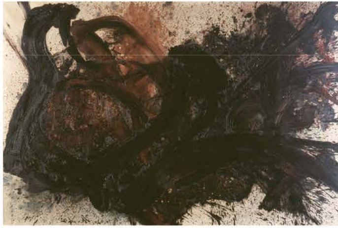
白髪一雄《天傷星行者》1960年 尼崎市蔵