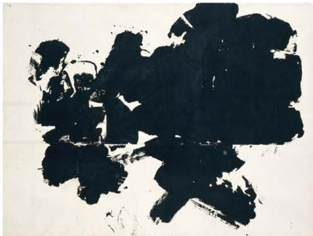
江口草玄《作品No.7》1955年 新潟県立近代美術館・万代島美術館蔵