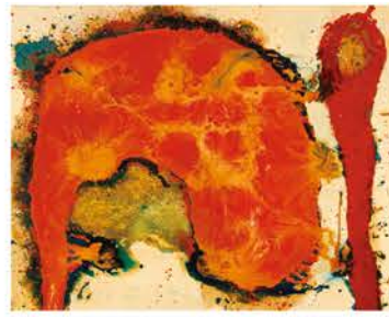
元永定正《作品、ピンク・赤・91》1960年