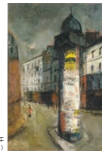
佐伯祐三《広告塔》1927年(「異国に渡った芸術家たち」より)

【展示室1】 近代美術館の名品 一新収蔵品を中心に 【展示室2】 異国に渡った芸術家たち 【展示室3】 三芳悌吉 絵本の仕事 —科学の眼差し