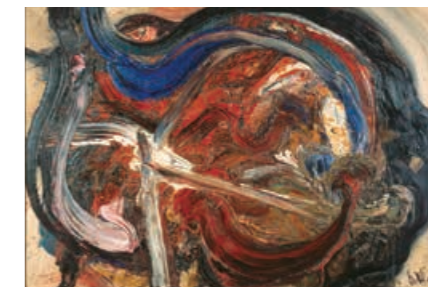
白髪一雄《天宮星撲天騷》1963年 尼崎市蔵

2024年1月13日(土)～2月25日(日) 尼崎市コレクション 白髪一雄 The Collection of Amagasaki City: SHIRAGA Kazuo 休館日:1/15(月)、22(月)、29(月)、2/5(月)、13(火)、19(月)