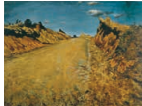
岸田劉生《冬枯れの道路(原宿附近写生)》1916年(「大光コレクション」より)

【展示室1】 開館30周年を記念して ニイガタキンビ誕生の頃 【展示室2】 大光コレクション 【展示室3】 亀倉雄策