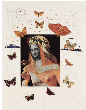
1.《地獄篇26:ケンタウロスのカス(第26歌)》(ダンテ・アリギエーリ『神曲』より) 1963 / 2.《やわらかい時計》(『15の版画集』より) 1968 / 3.《シュルレアリスムの花嫁》(『シュルレアリスムの思い出』より) 1971 / 4.《蝶に囲まれたダリのシュルレアリスムの肖像》(『シュルレアリスムの思い出』より) 1971 © Salvador Dalí, Fundació Gala-Salvador Dalí, JASPAR Tokyo, 2022 E4744