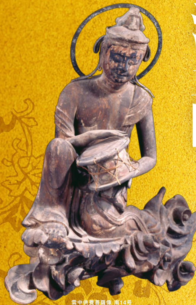
雲中供養菩薩像 南14号 天喜元年(1053) 平等院蔵 前期(4/23~5/15) 展示