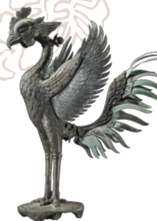
本展では、昭和43年に実 際に平等院鳳凰堂に上棟 されていた《鳳凰像 模造》 (昭和31年制作)を展示

京都府宇治市に位置する平等院は、ユネスコの世界遺産に も登録される古都京都を代表する名刹です。疫病(天然痘) の流行や地震の頻発、相次ぐ合戦などによって世に不安と混乱 が広がった時代、宇治川沿いにあった貴族の別荘を公卿・ 藤原道長が譲り受け、「末法初年」とされた1052年、息子 の藤原頼通が寺院に改めたものです。現世に極楽浄土を再現 するべく壮大な伽藍が整備され、その中心となる鳳凰堂には 定朝作の本尊・阿彌陀如来坐像(国宝)を安置し、堂内には 鮮やかな彩色による浄土図や来迎図が描かれました。 平等院では近年、創建当初の姿の復元を目指し、鳳凰堂の 修理や調査研究が進められています。本展では、雲中供養菩薩像 (国宝)に代表される鳳凰堂ゆかりの名品を中心に、調査の過程 で発見された貴重な宝物や往時の華麗な堂宇を偲ばせる復元 模写・模造、さらには養林庵書院(重要文化財・襖絵など、塔頭 の浄土院に伝わる寺宝も紹介します。国風文化と浄土信仰の 象徴であり、いにしえから現代までの文化と美が融合する平等院 の輝きを、本展を通して感じていただければ幸いです。