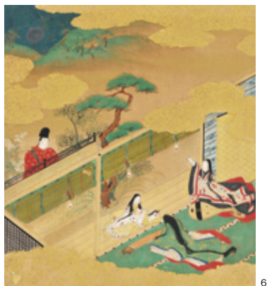
①国宝《雲中供養菩薩像 北1号》天喜元年(1053) 平等院蔵 【前期(4/23~5/15)展示】②国宝《雲中供養菩薩像 北13号》 天喜元年(1053) 平等院蔵 【後期(5/17~6/5)展示】③宇 治市指定文化財 伝狩野山雪《籬に梅園(養林庵書院模倣)》 江戸時代(17世紀) 浄土院蔵 ④宇治市指定文化財《伝帝釈 天立像》平安時代(11世紀) 浄土院蔵 ⑤荒木忠信《日想観 想定復元模写》平成24年(2012) 平等院蔵 ⑥伝土佐光則《源 氏絵巻帖》より(橋姫)江戸時代(16~17世紀) 宇治市源氏物語 ミュージアム蔵【前・後期で場面替】

京都府宇治市に位置する平等院は、ユネスコの世界遺産に も登録される古都京都を代表する名刹です。疫病(天然痘) の流行や地震の頻発、相次ぐ合戦などによって世に不安と混乱 が広がった時代、宇治川沿いにあった貴族の別荘を公卿・ 藤原道長が譲り受け、「末法初年」とされた1052年、息子 の藤原頼通が寺院に改めたものです。現世に極楽浄土を再現 するべく壮大な伽藍が整備され、その中心となる鳳凰堂には 定朝作の本尊・阿彌陀如来坐像(国宝)を安置し、堂内には 鮮やかな彩色による浄土図や来迎図が描かれました。 平等院では近年、創建当初の姿の復元を目指し、鳳凰堂の 修理や調査研究が進められています。本展では、雲中供養菩薩像 (国宝)に代表される鳳凰堂ゆかりの名品を中心に、調査の過程 で発見された貴重な宝物や往時の華麗な堂宇を偲ばせる復元 模写・模造、さらには養林庵書院(重要文化財・襖絵など、塔頭 の浄土院に伝わる寺宝も紹介します。国風文化と浄土信仰の 象徴であり、いにしえから現代までの文化と美が融合する平等院 の輝きを、本展を通して感じていただければ幸いです。