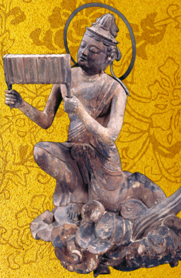
雲中供養菩薩像 南1号 天喜元年(1053) 平等院蔵 後期(5/17~6/5) 展示