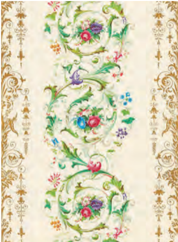
1.《花とロココ調スクロール》1850年頃