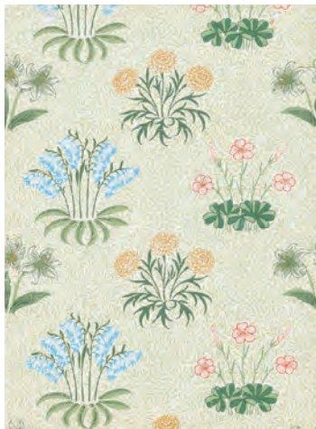
4.ウィリアム・モリス《リリー(ゆり)》1874年(印刷)