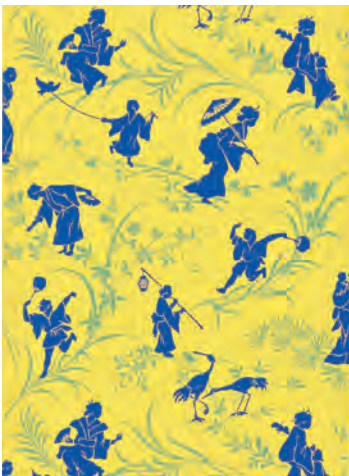
2.《日本風の影絵壁紙》20世紀初期