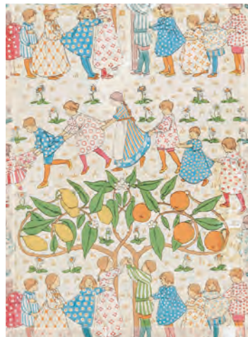
6.ドロシー・ヘイトン《オレンジとレモン》1902年頃