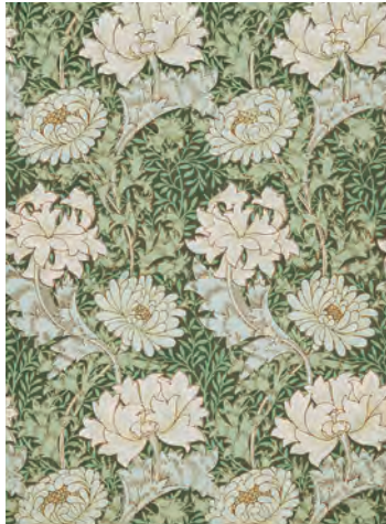
3.ウィリアム・モリス《クリサンセマム(きく)》1877年(印刷)