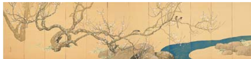
川合玉堂《春苑》1919年 〔「近代美術館の名品」より〕 ※前期のみ展示