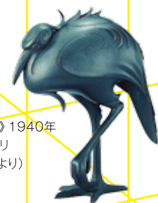
山本自炉《銅鸞香炉》1940年 〔「バード・サンクチュアリ 一鳥たちの造形」より〕