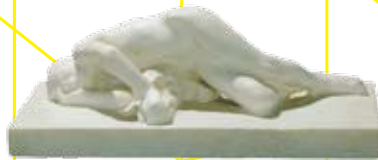
オーギュスト・ロダン 《疲れ》1887年頃 〔「彫刻 ~素材の魅力~」より〕