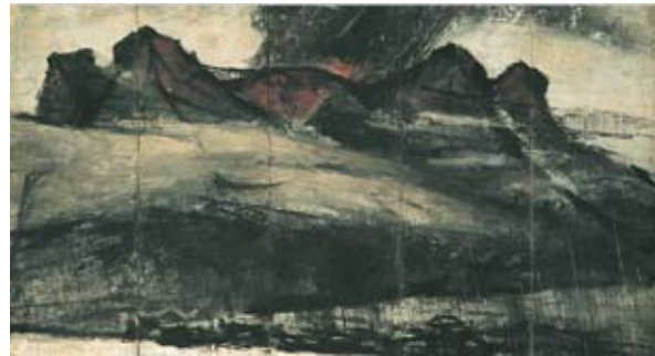
横山 操《炎々桜島》1956年 〔「国民文化祭関連展示 新潟の美術 / 小特集 横山 操」より〕