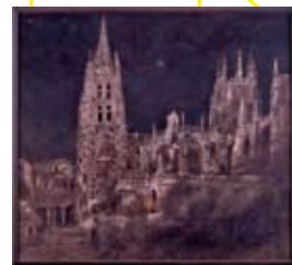
八田 哲 《夜のカテドラル》 1989年 〔「夜景」より〕