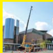
空調機器交換工事作業

平成5年(1993)7月15日に開館してから、昨年平成30年(2018)7月で25年の月日が経ち、施設の老朽化や不具合等が目立ってきました。そのため、全面休館して設備等の更新や一部改修工事を行っています。作品と来館者にとって、より安全で快適な美術館としてリニューアル・オープンします。