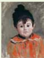
クロード・モネ《ボンボン付きの帽子をかぶったミシェル・モネの肖像》 1880年 油彩、カンヴァス 47×37cm Musée Marmottan Monet, Paris

ジュニアガイドと特製しおりを各日先着500名様にごプレゼントします。 日時 8月1日(月)、8日(月)、15日(月)