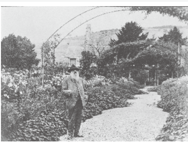
ジヴェルニーの庭のモネ 撮影者不明、撮影日不明 Musée Marmottan Monet, Paris

モネは1883年、パリからおよそ80km北西にあるジヴェルニー村に移り住み、後半生を過ごしました。ここで創作をするかたわら、庭作りに熱中します。