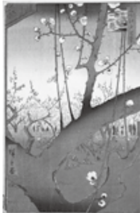
図5 歌川広重《名所江戸百景 亀戸梅屋舗》1857年

浮世絵のこうした構図法とボナールの作品とのつながりを示すために、もう一つ例をあげてみたい。北斎から刺激を受けて生まれたといわれる歌川広重の《名所江戸百景 亀戸梅屋舗》(図5)という作品に、同様の構図法がみられる。樹木を画面に一番近いところに大きく配し、フレームの中に収まりきれなくて飛び出しているという構図である。近景にあるものを極端に大きく描いて遠近感を強調する浮世絵の構図は、19世紀末のフランスの画家たちに大きなインパクトを与えた。広重