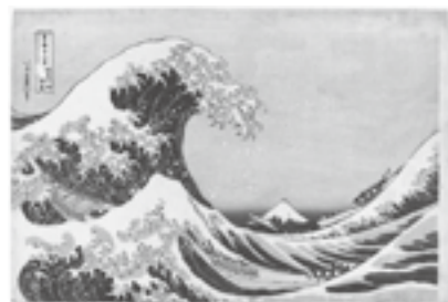
図21 葛飾北斎《富嶽三十六景 神奈川沖浪裏》1830-33年頃