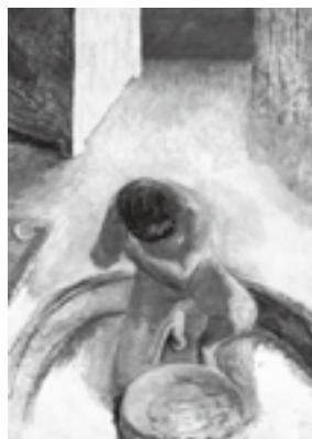
図10 ボナール《浴盤の裸婦》1916年 油彩、カンヴァス、140×102cm、個人蔵

《浴盤の裸婦》(図10)は、ほぼ同様の構図で複数点の油彩画を制作していることから、この画家にとって非常に重要な意味をもつと考えられる作品である。一見すると、三次元的な奥行きをもった室内画だが、同時に、幾何学的図形あるいは平面性に対する強い関心がよみとれる。至近距離から見下ろすような高い視点をとることによって、たらいの輪郭が円形に近づいている。たらいの曲線と、奥のキャビネットの直線のコントラストが鮮やかである。幾何学的な図形、あるいは抽象的な構想にもとづいて制作された作品である。コダックの写真機を購入し、一時期撮影に熱中したボナールには、この作品によく似た写真が残っている(図11)。恋人のマルトがモデルを務めており、ポーズやモチーフなど両者には共通している点が見られる。しかし、写真と油彩作品とでは、構図に対する意識が大きく異なっている。写真の方では、前景にバスローブのような大きな布の塊が写り込んでいる。偶然写り込んだように見えるが、これはむしろ、意図的に障害になるものを手前に置いて、その後ろに本来のテーマであるマルトを配したもののだろう。近景と遠景を重ねていくことによって遠近感を出すという、ナビ派的な構図法によって写真を撮ったものである。一方、1916年に制作された油彩作品の場合は、画面をさえぎっていた障害物はなくなり、本来のテーマである裸婦が近景に描かれている。たらいがこのように完全な円弧として見えるためには、相当な至近距離から見下ろさなければならないが、ボナールは極端な俯瞰視によってたらいを入れた上で各モチーフを配置している。身近に存在するものや自然のなかにあるものの幾何学的な図形を活かしながら画面を構成していくという構図法を、意識して用いているといえる。即ち緻密に計算された画面構成であって、偶然生まれたスナップショット的な構図ではない。