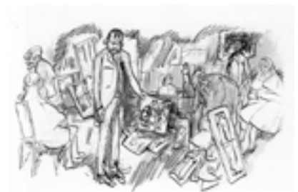
図23 ボナール《ピエール・ボナールのアルバム(画家の人生)》(部分) 1910年頃、鉛筆、インク、紙、オルセー美術館(ルーヴル美術館寄託)、パリ

共にジャポニスムの優れた作品を残した二人の画家の間に、実際に接点はあったのだろうか。ボナールが自らの半生を一連のデッサンで表した《画家の人生》というアルバムの中に、その鍵となる一葉がある(図23)。舞台となっているのは画商ヴォラールの店の中である。モーリス・ドニによる集団肖像画《セザンヌ礼讃》(1900年、オルセー美術館)では、ヴォラールの店のなかにナビ派の画家たちが集う姿が描かれているが、ここでは印象派の画家たちが表されている。中央にいる長身の男性がヴォラール。左側でハンチング帽を