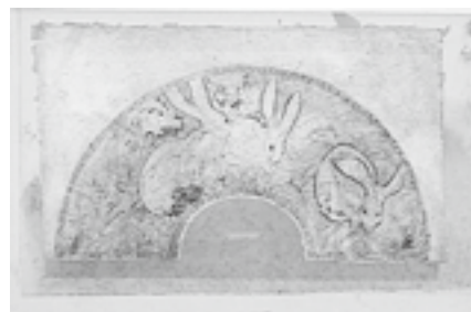
図15 ボナール《扇の下絵：野原の兎》鉛筆による下描の上に筆と褐色インク、紙、33.6×57.5cm、オルセー美術館、パリ