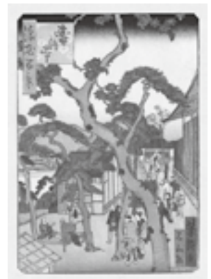
図8 歌川芳瀧《浪花百景 寿法寺》安政年間