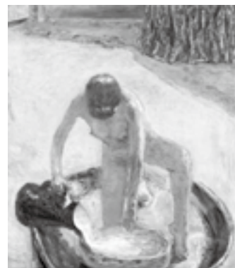
図17 ボナール《浴盤にしゃがむ裸婦》1918年 油彩、カンヴァス、83×73cm、オルセー美術館、パリ