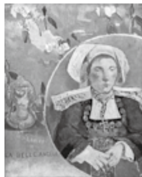
図13 ポール・ゴーギャン《美しいアンジェール》1889年 油彩、カンヴァス、92×73cm、オルセー美術館、パリ