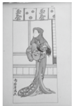
図2 鳥居清満《役者(女形)》『藝術の日本』第25号、1890年5月