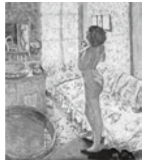
図9 ボナール《逆光の裸婦 あるいは バラの長椅子のある化粧室》1908年、油彩、カンヴァス、124.5×108cm、ベルギー王立美術館、ブリュッセル

官能的な親密さを漂わせていた寝室の裸婦に代わって、1908年頃から化粧室の裸婦が描かれるようになる。《逆光の裸婦 あるいは バラの長椅子のある化粧室》(図9)は、窓から入ってくる外光が部