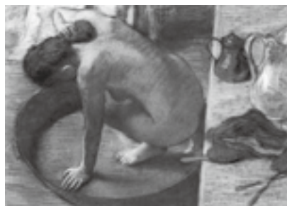
図22 エドガー・ドガ《たらいで湯浴みする女》1886年、パステル、厚紙、60×83cm、オルセー美術館、パリ

ドガの《たらいで湯浴みする女》(図22)は、1880年代にドガが描いた一連の裸婦連作のなかでも、はりつめたような空気に満ちた優れた作品である。裸婦を見る視点の位置を探るために、画面右側三分の一ほどの四角形の部分に注目すると、水差しとブラシが置かれているので、それがテーブルであることがわかるが、何も置かれていなければ、直立する壁のように見えるかもしれない。実際のテーブルは床に平行である訳だが、それがほぼ垂直に立って見えることで、この作品が上から見下ろされている場面であることがわかる