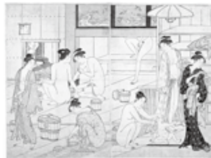
図19 鳥居清長《女湯》1787年頃、ボストン美術館

大胆にトリミングされた女性の裸体であるが、モチーフの切断は浮世絵などの日本美術に特徴的な手法とされている。裸婦がトリミングされて下半身だけが画中に描き込まれた例を、浮世絵に探すと、たとえば鳥居清長の《女湯》(図19)という版画がある。江戸時代の銭湯の場面で、女性の下半身が画面上部から降りてきているところが描かれており、この作品の一つのみどころとなっている。人物の下半身だけが見えるという状況は、江戸の共同浴場が、もともと蒸し風呂から始まっていた名残で、温かい蒸気が逃げないように入口の鴨居が大変低くつくられていた(当時「ざくろ口」と呼ばれた)という建築的構