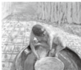
図16 ボナール《浴槽の裸婦(ブルーのハーモニー)》1917年頃、油彩、カンヴァス、46×55cm、個人蔵