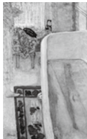
図18 ボナール《浴槽の中の裸婦》 1925年、油彩、カンヴァス、104.8× 65.4cm、テート、ロンドン

1925年に制作された《浴槽の中の裸婦》(図18)では、たらいに代わって、浴槽というモチーフが新たに登場してくる。いくつもの矩形を組み合わせて画面を構成した端正な作品である。この沐浴図は、画面のなかに女性だけでなく男性の姿が描かれている点で、特殊な作例ではあるが、1910年代から20年代にかけてボナールが取り組んできた、化粧室の沐浴図の一つの到達点、あるいは完成形として位置づけ得る作品である。この作品を含め、同時期に描かれたいくつかの沐浴図については伝記的側面からアプローチする研究が目立つ 9 。ここではジャポニスムの観点に立って、造形的な分析を通して、この作品に込められた意味を探ってみたいと考える。