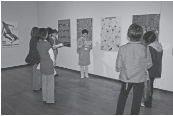
【図2】 アートボランティア同士による「亀倉雄策展」解説会(2010[平成22]年度)

当初提示された④については、以降も幾度か活動方法が模索された。学芸員からの提案により、2009(平成21)年度には企画展「土田麦僊展」、2010(平成22)年度には企画展「牧野虎雄展」、常設展「亀倉雄策展」に関連して、学習会とアートボランティア同士での作品解説会が試みられている【図2】。特に2010(平成22)年度の「亀倉雄策展」は、アートボランティアたちが、前年度から亀倉雄策関連資料の整理補助を行っており、その成果が反映された展覧会であった。亀倉雄策についてもっと知りたい、という要望もボランティアたちの中から上がってきており、充足感もひとしおだったようだ。将来は、当初からの目的のひとつである来館者向けの展示品解説を実施していくことが目標として確認されたが、これ以降活動は継続しなかった。