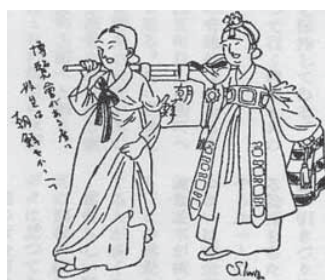
図11 岩本善併・岩本正二「京城漫談風景」 『朝鮮公論』220(1931年)(図9部分)