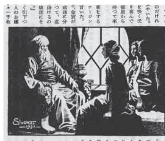
図13 春海浩一郎・文／岩本正二・画「憑魔の壺」(1)『朝鮮公論』224(1931年)

浩一郎の小説『憑魔の壺』の挿絵も岩本が手がけているが(図13)、この挿絵においては、線ではなく面を中心としており、極端な明暗法が用いられ、イリュージョニスティックな空間表現が用いられている。サインは「S.IWAMOTO」とあり、油彩などのタブローを意識していることが見て取れる。このような極端な明暗法や空間表現は、1933年に『京城日報』で連載された川路柳虹の小説『翼なき鳥』(図14)の挿絵におい