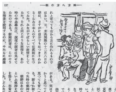
図18 岩本正二「四方八方の話」『朝鮮公論』351(1942年)