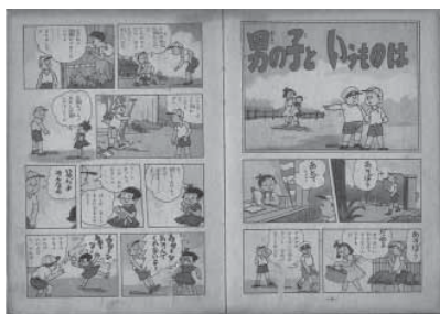
図7 岩本正二「男の子というものは『少年の町2』東京三共図書、1956年