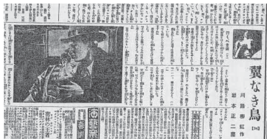
図14 川路柳虹・文／岩本正二・画「翼なき鳥」(24)『京城日報』1933年6月11日

でも用いられており、さらに時代が下った1940年、『京日小学生新聞』に連載された林タテヤスの児童文学『チビ哲物語』の挿絵(図4)においても、より簡潔な表現になってはいるものの、依然として用いられて