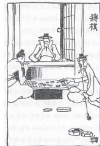
図2 鳥越静岐(細木原青起)・薄田斬雲『朝鮮漫画』京城:日韓書房, 1909年

とはいえこの数年、朝鮮半島での日本人漫画家の活動についての研究も進んできており、その優れた例として、韓日比較文化セミナーが編集した『朝鮮漫画 100年前朝鮮漫画になる』(図2)がある。 5 この書籍は、当時は「鳥越静岐」と名乗っていた細木原青起(1885-1958)らによって1909年に制作された『朝鮮漫画』その他を翻訳して考察するもので、100年前の日本人漫画家が朝鮮をどう見たかというものが主要テーマとなっている。『朝鮮漫画』の作者である細木原青起は「東京漫画会」所属の漫画家であり、『京城日報』や雑誌『朝鮮』に漫画を描いていたものの、むしろ『東京日日新聞』や『大阪朝日新聞』など内地の新聞が活動の中心であった。細木原青起は、日本では初めての漫画の通史である『日本漫画史』を1924年に出版している。 6