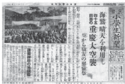
図3 『京日小学生新聞』1940年10月27日 第1面

岩本正二の名前は、『京城日報』および『朝鮮公論』に漫画家・挿絵画家として登場する。とりわけ『朝鮮公論』においては、漫画や挿絵画家のみならず文才を活かして数々のエッセーを執筆してもおり、朝鮮公論社の記者という性格もある。 8 そして戦争中は『京城日報』の小学生向け新聞である『京日小学生新聞』(図3, 4)で漫画等を担当していた。