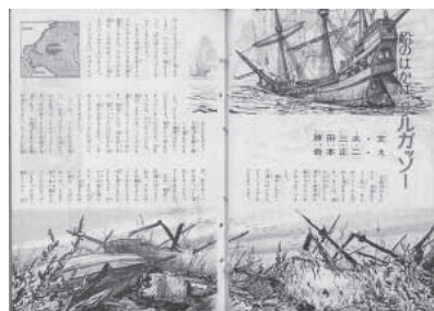
図8 岩本正二「船のはかばサルガッソー」『こども科学館』20(1962年)