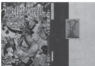
図6 秋吉憐「風俗草紙」1953年9月号 表紙絵