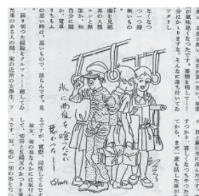
図12 岩本正二「京城漫談風景」(3) 『朝鮮公論』222(1931年)

ルで日本を憶ふなら、キーセン・ガールで朝鮮を憶ふだらう」と、ステレオタイプな朝鮮イメージを風刺している善併の漫文に、弟の正二は「朝鮮」と書かれた輿を担ぐ妓生をユーモラスに描いている(図11)。また、連載第3回目では、京城の市電の中でお腹を下し下痢を我慢している中学生が、女学生たちの金切り声に耐えながらも一刻も早く下車したがっている様子を描いている(図12)。この「京城漫談風景」においては、一貫して細い均一の太さの描線が用いられている。また、滑稽さを強調するためのデフォルメは用いられず、文章の説明として過不足ない簡潔な表現に仕上がっている。全体として平面的な描写であり、周辺の活字とうまくマッチしていると言えるであろう。