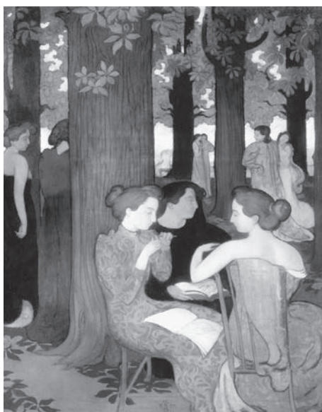
図4 モーリス・ドニ《ミューズたち》Les muses, 1893年、油彩・キャンヴァス、171.5×137.5cm、オルセー美術館蔵

《ミューズたち》(図4)は、1893年のアンデパンダン展に《ミューズたち：装飾的パネル》という題名で出品され、今日ではドニの代表作として最も世に知られている作品である 6 。文芸を司るミューズたちが、現代的なドレスをまとった若い女性の姿で描かれている。作品の題名ともなっている通り、中心主題はさまざまなポーズを見せる10人の女性たちであり、作品の完成後に結婚するこ