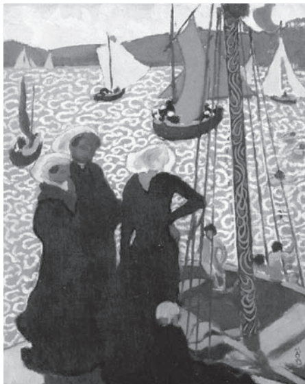
図2 モーリス・ドニ《ペロス・ギレックのレガッタ》Régates à Perros-Guirec, 1892年、油彩・キャンヴァス、42.2×33.5cm、カンパール美術館(オルセー美術館に寄託)蔵

樹木の表現方法をよく見ると、まるで芝居の書き割りのように扁平な描かれ方をしている。重厚な色調で描き込まれていることによって、重みと存在感が醸しだされているが、木全体の大きな立体感や凹凸を示す手がかりはない。あくまでも平面的に描かれている。目を凝らすと、一枚一枚の葉や枝のかわりに、虫はいずりまわった跡のような、有機的な模様が樹木を埋めつくしているのがわかる。同年にドニが描いた《ペロス・ギレックのレガッタ》(図2)では、海面が唐草模様のような曲線で覆われ、光きらめく波を表しているが、この樹木のパターンはその波模様 に似ている。最近の研究では、ペロス・ギレックの波模様は日本の布の模様にヒントを得たという可能性が指摘されている 3 。波と葉では色もモチーフも異なるとはいえ、同じ時期の二つのよく似た曲線には、おそらくジャポニス