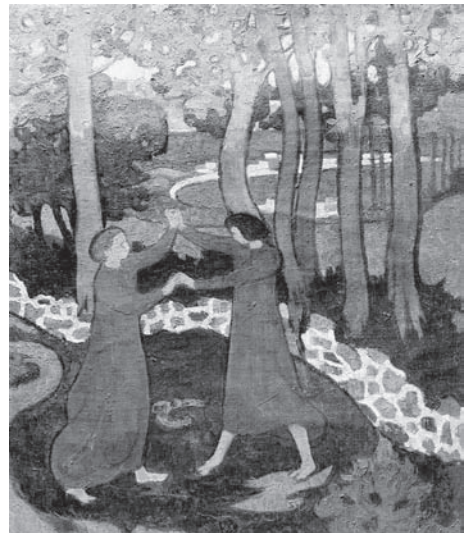
図5 モーリス・ドニ《ヤコブと天使の争い》、Lutte de Jacob avec l'ange、1893年頃、油彩・キャンヴァス、48×36cm、個人蔵

《ヤコブと天使の争い》(図5)は、1893年のバルク・ド・ブトヴィル画廊での展覧会に出品された作品である。主題は『創世記』からとられており、同主題の絵画としては、ドラクロワ(パリ、サン＝シュルピス礼拝堂壁画)やゴッゲン《説教の後の幻影》(エディンバラ、ナショナル・ギャラリー・オブ・スコットランド)などの先行例が知られている。夜を徹して正体のわからぬ手強い相手と闘っていたヤコブは、朝が訪れた時、その相手が天使であったことを知るというエピソードである。