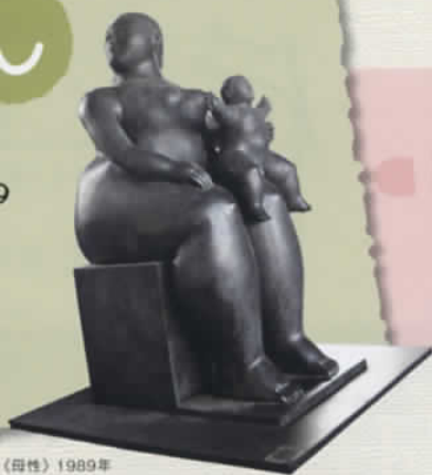
フェルナンド・ボテロ《母性》1989年