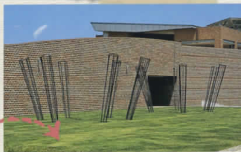
青木野枝《亀池・蓬池》1997年