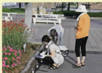
キャンドルナイト準備風景