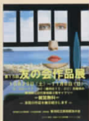
会員のデザインした作品展がスタート