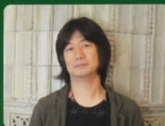
種田 陽平 Yohei Taneda

武蔵野美術大学油絵科卒業。記憶に残る映画の世界観創出で定評のある美術監督。「スワロウテイル」「不夜城」「キル・ビル Vol.1」「THE 有頂天ホテル」「フラガール」「ザ・マジックアワー」「悪人」と多くの話題作の美術監督を務め、その創造的な取り組みにより平成21年度芸術選奨文部科学大臣賞を受賞。映画の他、CM・舞台美術等幅広い分野で活動している。最新作は10月29日公開「ステキな金縛り」(三谷幸喜監督)。