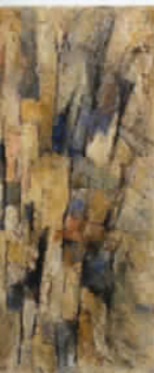
福井 (森の詩) 1960年