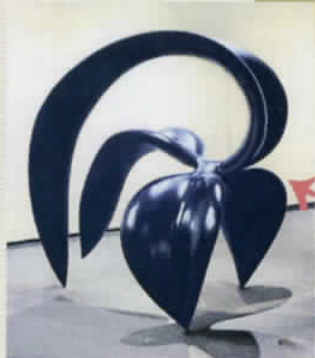
竹田隆宏 (Under the leaves) 1994年