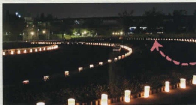
第3回 キャンドルナイト@Kinbi