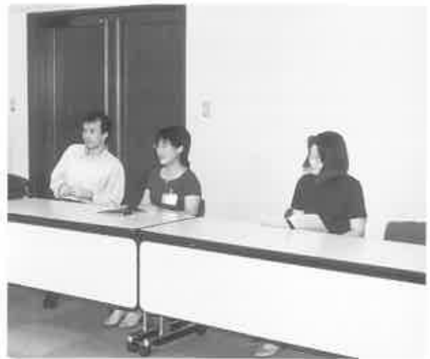
fig. 2 同左