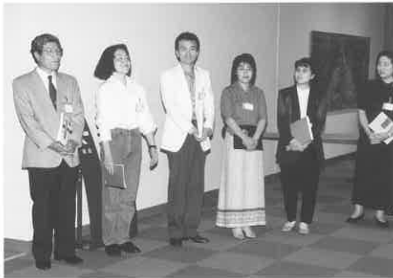
fig. 3 6人の紹介。緊張もピーク