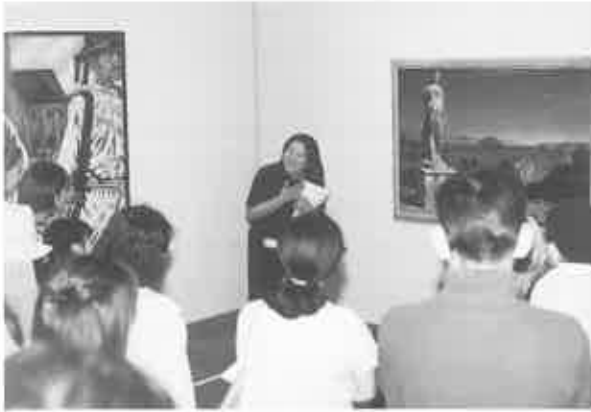
fig. 14 気持ちがかもります