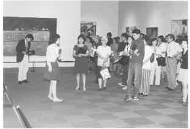
fig. 15 ギャラリーを引きつれて