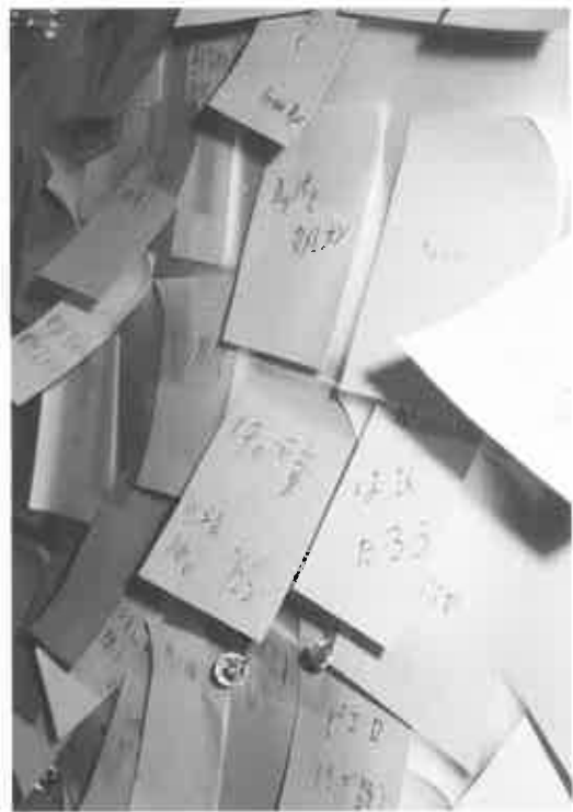
fig. 25 未来の河童!

気持ちが先行するのはいたしかたないとしても、担当する 学芸員自身が強く、大きくならない限り、せつかくの鑑賞者 のパワーも、それを受けとめ、生かしていくことはできない