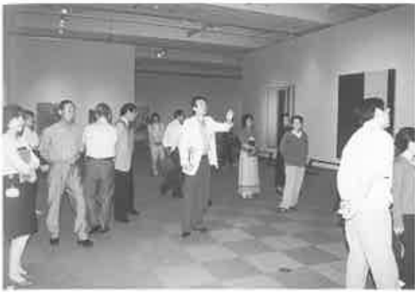
fig. 7 見上げて話す大きな作品