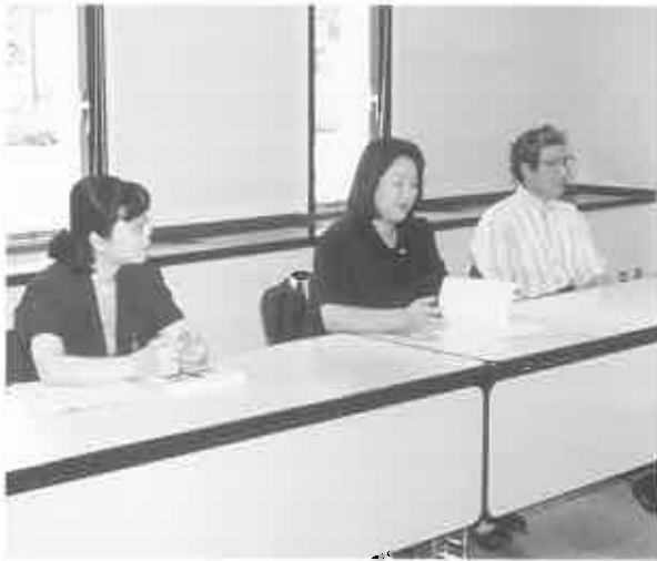
fig. 1 打ち合わせ。美術館内講義室にて