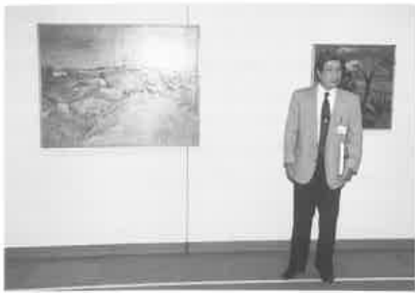
fig. 4 ゴッホの前で