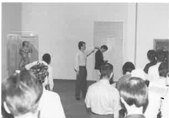
fig. 12 自然とポーズも…

ました。そして、黒柳さんと松永さんの論戦はますます白熱し、ついには周囲の来館者たちまで巻き込むほどになりました。飛び入りで、議論に参加する人までが現れてきたのです (fig. 17)。