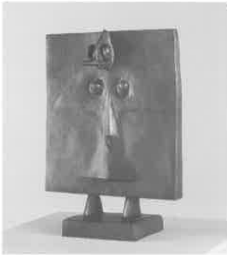
fig. 20 マックス・エルンスト (……) ブロンズ 1934/35

す。この作品を出すことは、企画当初からの念願であり、最もやりたかったことでした (fig. 20)。