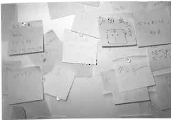
fig. 24 一部ですが…

ある、というだけではなく、それらが互いに思い合っている と捉えたタイトルが、けっこう多かったのです。「友情(もし くは種をこえた2人の交流)」という発想を、もしもエルン ストが聞いたら、何と答えてくれるでしょうか。