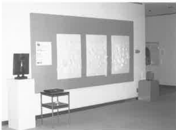
fig. 21 初日

の本質について考えを巡らすものではないでしょうか。そうでなければ自分の本質、あるいは、自分の夢や願望といったものが、名付けの作業には反映されるように思います。相手が美術作品であっても、おそらく、そのような心理は働くものと思われ、また、全ての情報が与えられている時よりも、「名前をつける」という能動的な行為を通すことによって関わり方は一層深さを増すのではないかと、というのが狙いです。相手が反具象の、何かよくわからない彫刻であればなおのこと、一筋縄ではいかずに、反応も多様なものとなるでしょう。