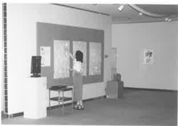
fig. 23 日課となった剥がし作業

そうやって外した付箋は、公表するものと、上記の中傷の類のような公表しないものに分け、前者は簡単に分類してリスト化しました。平成10年からしばらくの間は、そのころ立ち上げたばかりの当美術館のホームページ上に載せてもらっていました。また、このたび再度、当館のホームページ