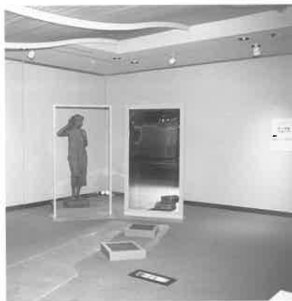
fig. 18 このポーズは意外と難しい

二つの木枠は、角度をつけて、ずらして並べ、立つ位置によって見える角度も変化するようにしておきます。