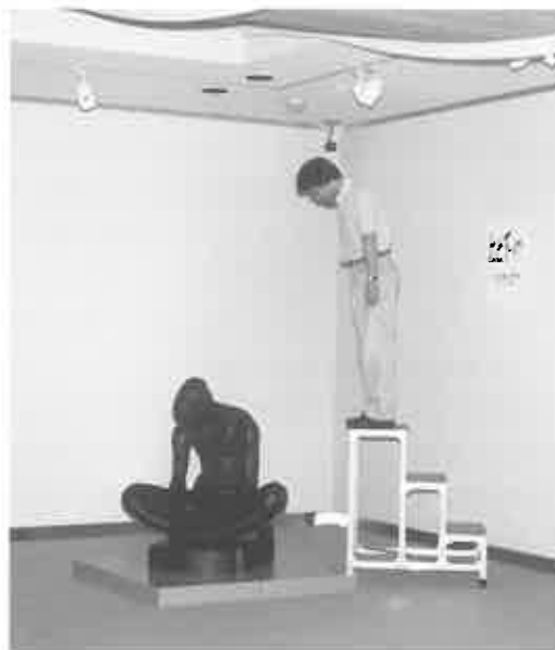
fig. 19 3mの高さから見下ろす

普段から、子どもと大人、背の高い人と低い人では同じ作品でも違う形で見ているわけですが、そのことを、私たちは