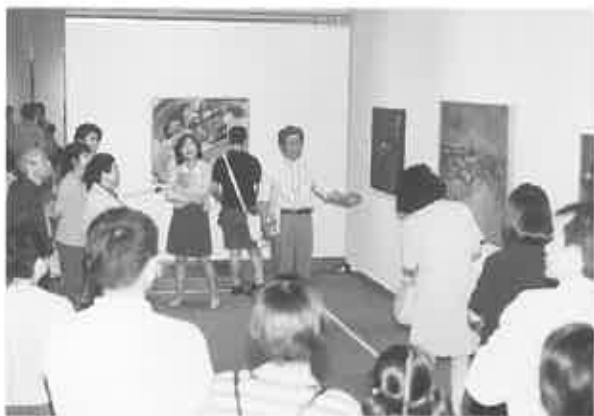
fig. 11 2回目の本番。平成9年6月22日 (日)