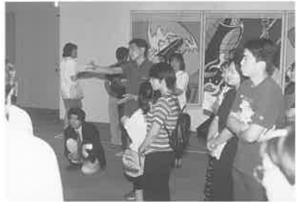
fig. 17 たまらず参戦!

を知ることは、必ずしも幸福になることを意味しません。たとえば、彼らが周囲の人々に今回の体験を伝えようとしても、うまく伝わらなかったり、全く受け入れられなかったとしても、あながち不思議ではないのです。もしかすると、むしろこの体験こそが、実生活上の小さな孤独の種となった可能性さえあるでしょう。(そうではなかったことを信じていますが……)。