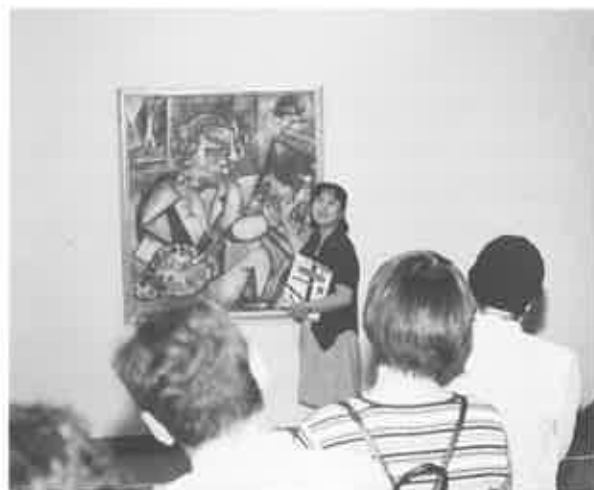
fig. 13 12本の指がロボを指す

しかしながら、地域社会において、自分の感性を大切に意識し、さらに、それを何らかの形で表現していくことの喜び