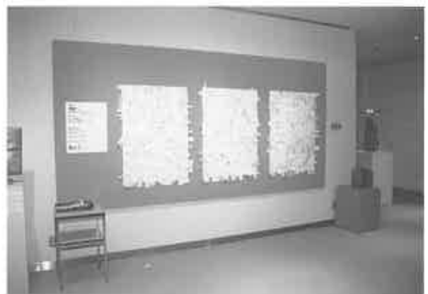
fig. 22 次の日には…

しかし、その心配は杞憂でした。翌日から着実に、パネルには付箋が貼られていきました。それらは着実に増えていき、