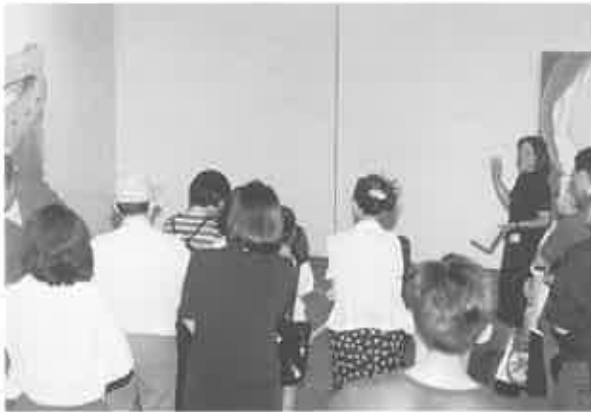
fig. 16 腕組みは考えている証拠