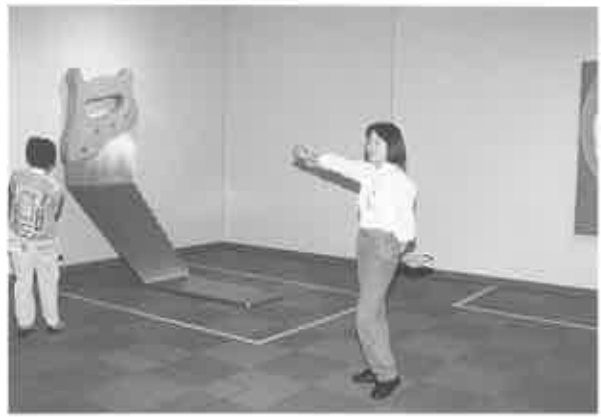
fig. 9 対峙するノコギリ