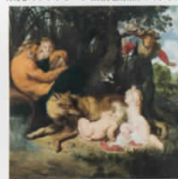
ペーテル・パウル・ルーベンス(ロムルスとレムスの発見) 1612-13年頃、ローマ、カピトリナ絵画館蔵