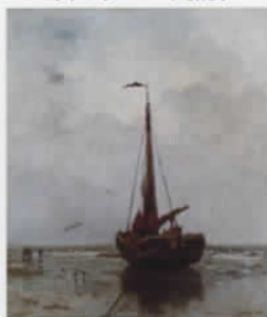
ヤコブ・マリス(漁船)1878年 ハーグ市立美術館蔵 Collection Gemeentemuseum Den Haag, The Hague, The Netherlands