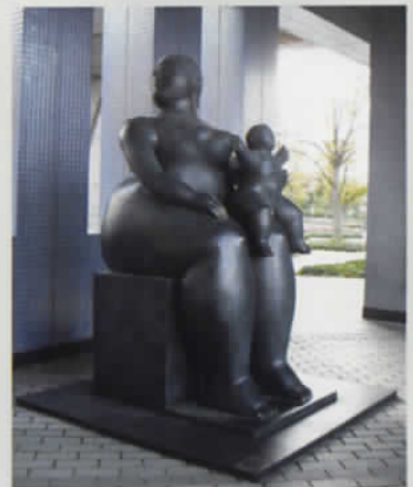
美術館入口で来館者を迎える《母性》(1989年)