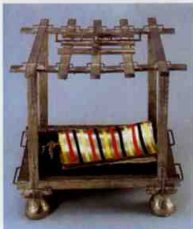
三代高田観堂（結りのない物語「五合庵の巻」）1934年