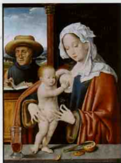
ヨース・ファン・クレーフェ（聖家画）1515年頃