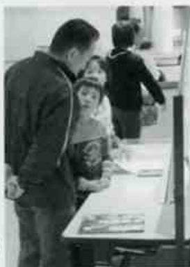
震災や戦争様々な体験を伝えていくために設置された「あの朝私は」のコーナーにはたくさんの声が寄せられました。