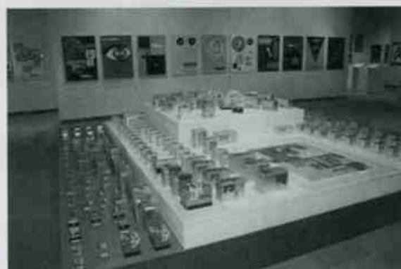
ニコンカメラ・レンズのパッケージが一堂に。圧巻でした。