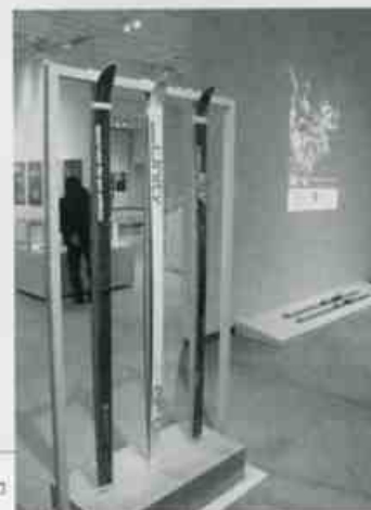
電食デザインのオガサカスキーも登場。