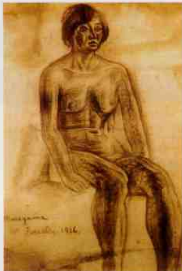
村山潤多（複製）1918年（複製コレクション）