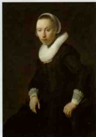
レンブラント・ハルメンス・ファン・レイン 《若い女性の肖像》1632年