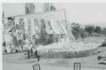
美術館の壁がハンカチで覆われました。