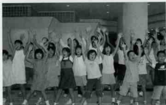
開場式では、長崎少年少女合唱団のみなさんが元気な歌声を響かせてくれました。