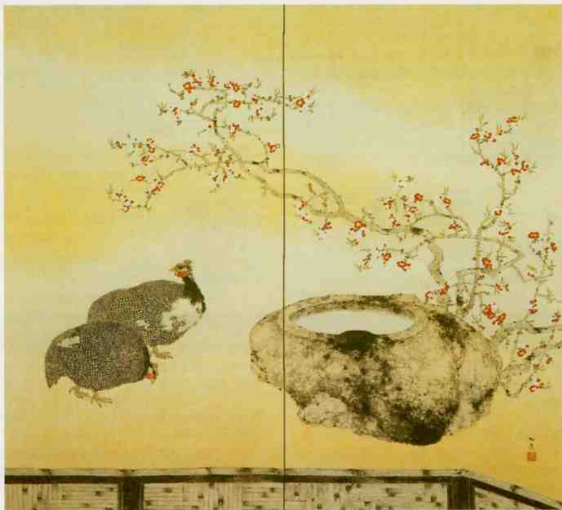
小杉放庵〈春秋屏風〉より春図 1937年 151.8×166.1cm 紙本彩色 二曲一双屏風

日本美術院で活躍した小杉放庵（1881～1964）は、1930年（昭和5）に妙高の赤倉温泉に別荘を建てた後、そこでの制作を重ねるようになります。本作は春秋の景色を描いた一双屏風の片方で、春の庭にホロホロ鳥が遊ぶさまを写したものです。画家自身が考案した麻紙に墨華の技法を生かして描かれ、木瓜の花の色づきやホロホロ鳥の緻密な柄が典雅な趣をかもし出しています。