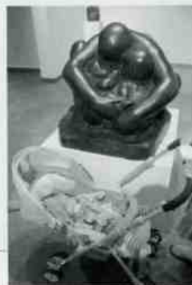
《母と二人の子》の像の前で。