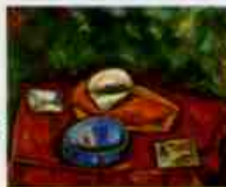
静物画（赤と緑の静物） 1928年