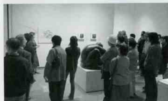
震災からちょうど一年となった展覧会最終日(10/23)は観覧無料となりました。