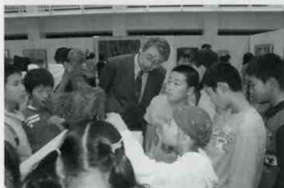
平成17年度は美之行、五華、三和の3会場で開催。たくさんの方々が名品とふれあ いました。写真は道之谷中学校の様子。