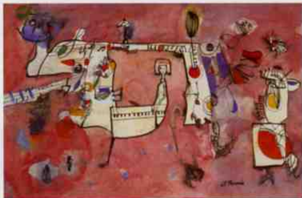
難波田史男（東画）1968年（複製コレクション）