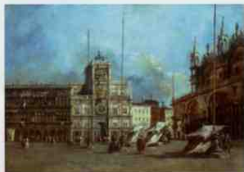
フランチェスコ・グアルディ 《サン・マルコ広場と時計塔》1770年頃