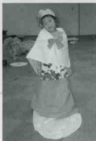
11/6日 「ときめき☆ファッション」 将来はファッションデザイナー!? 個性的なスタイルができました。