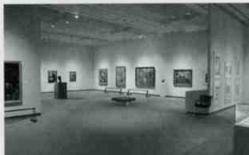
普段はなかなか見ることのできない作品が並びました。