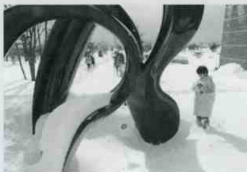
2/5日 「雪の中の野外彫刻めぐり」 1mほど積もった雪の上を踏みしめながら の探検です。彫刻もいつもとは違った表 情を見せてくれました。