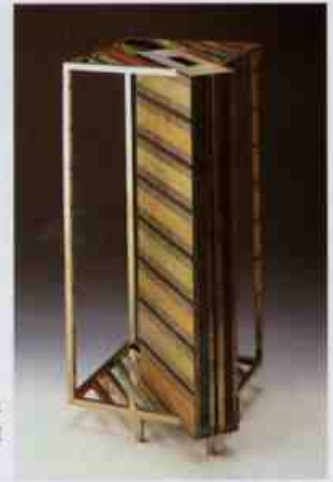
図2《生命の透視風》1982年 千葉県立美術館蔵