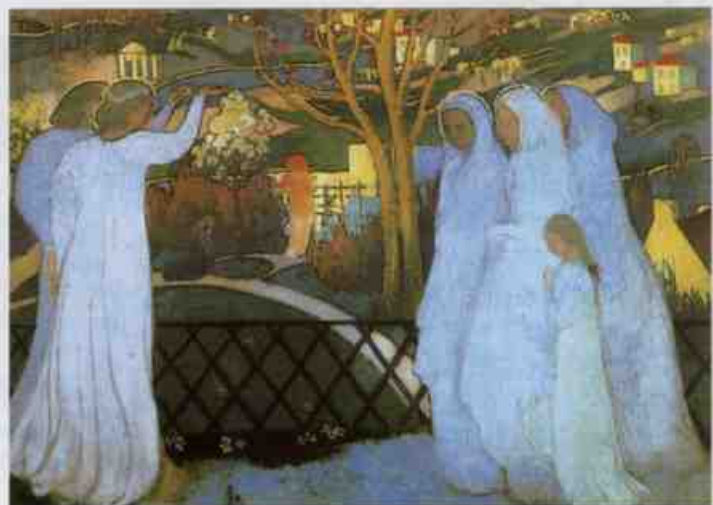
《キリストの墓を訪れる聖女たち》1894年