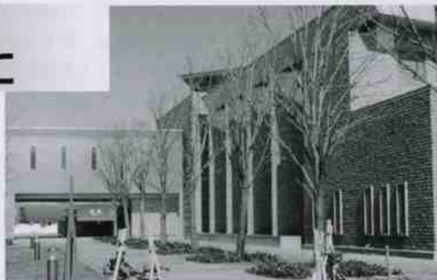
美術館前面のトチの木 今年も葉を繁らせてくれることだろう。

翻って考えれば、美術館の立地条件も決して恵まれていたとは言えない。長岡市の川西地区。長岡市民には僻地と言って憚らない人もいた。雪は中心街より多く降る。今のように循環バスも走っていなかった。「交通アクセスが悪い」と沢山の人の目にさらされた。