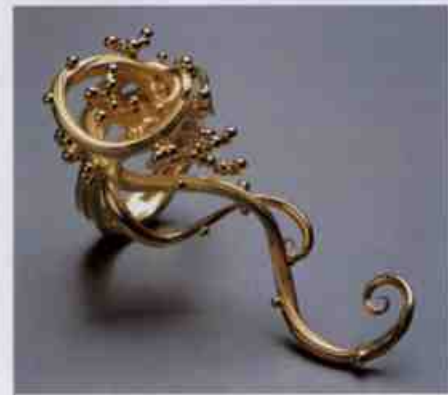
図3《回転 美豆波乃女》1977年 個人蔵

実現することになりました。同館の所蔵するナビ派時代の珠玉の作品を含む約80点に加え、当館所蔵の油彩画《夕映えのマルト》《ベンガル虎、バッカス祭》、版画集《アムール》も合わせて展示いたします。モーリス・ドニの「純情、端麗、清鮮」で優しさにあふれる芸術をどうぞお楽しみに。