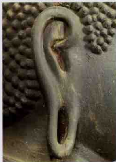
快慶作品の耳（阿弥陀如来像 奈良 西大寺蔵）