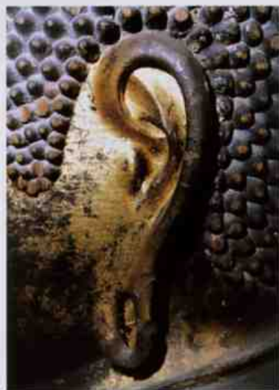
運慶作品の耳（阿弥陀如来像 静岡 願成院蔵）

快慶作品の耳はとでもきれいにまとまった形をしているのが特徴です。神経質と言っていいくらいに形が整えられています。その特徴は実は快慶作品の全体の作風に通ずるものです。逆に言えば快慶の作風の特色が凝縮された形で耳にあらわれているとも言えます。これと比べると運慶作品の耳は実に力強い、のびやかな耳です。快慶と運慶の性格の違い、作風の違いがそのまま示されていると言ってよいでしょう。