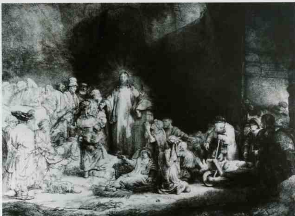
レンブラント・ハルメンスゾーン・ファン・レイン

四月の国立西洋美術館展の版画の部にはデューラーもレンブラントも刷りの良い名品が出る。その殆どが私の在任中に購入したもので、それぞれに思い出がある。特にレンブラントの百グルデン版をよく見て欲しい。神品とはこういう作品を言うのである。しかも17世紀の半ば近くに日本からオランダへ輸出された雁皮紙に刷っている。まさに版画のミュージアムピースであるが、余り展示はして欲しくないという気持もあって些か複雑である。何しろ350年ほど前の紙である。我が国が鎖国という名の巧妙な管理貿易体制に入ってもなくの頃に遠く欧州へもたらされた紙が里帰りしたわけで、浮世絵版画はまだ生れていない時代に西洋で珍重されたのである。奇なるかな。