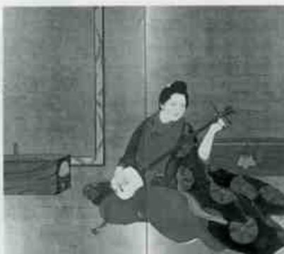
下村鶴山（元禄美人）明治32年（1899）石水博物館蔵

明治維新以後、新政府が積極的に西洋文化の導入に努めた結果、フェノロサの来日、京都における円山四条派の流れをくむ画家たちの台頭、東京美術学校の開校など