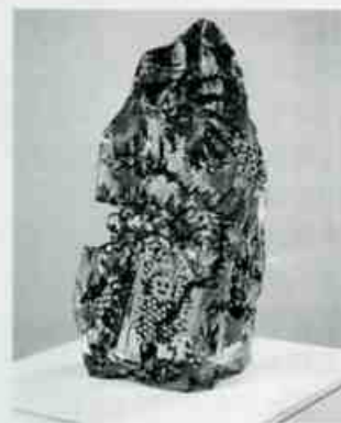
1993年 光学ガラス、油彩 63×31×22cm

このようなガラスの美しさと作者の人間的な明るいユーモアや美的感覚との融合が親しみやすさの秘密といえるでしょう。