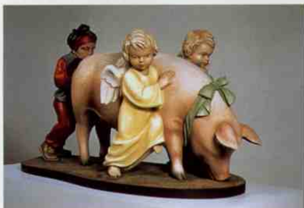
ジェフ・クーンズ《色んなものの世界》1986年

もちろん肯定するばかりが能ではありません。否定もまた結構。とにかく来て、見て、大いに語り合ってください。全てはそこから始まるのでしょから…。