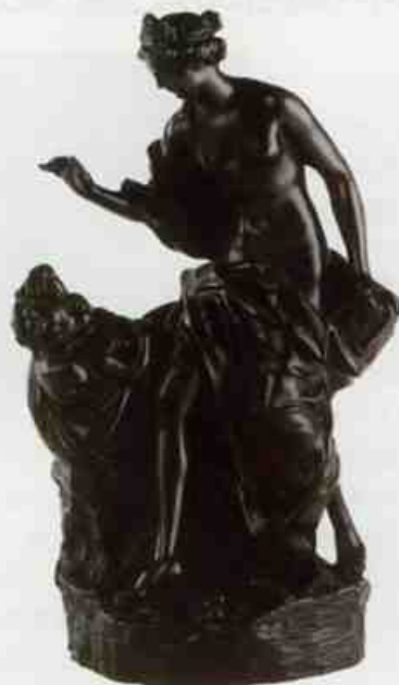
コルネイク・ヴァン・クレーブ《フシケとキューピッド》1700~10年頃